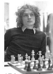
17 jaar oud

Leeftijd telt niet, maar passie wel in de wereld van schaken! Schaken is voor jong en oud!