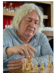
72 jaar oud